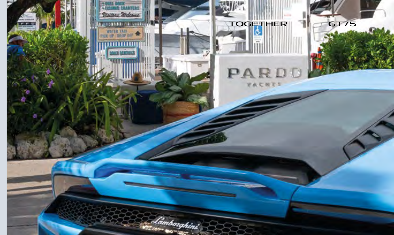
MIAMI - PARDO YACHTS & LAMBORGHINI