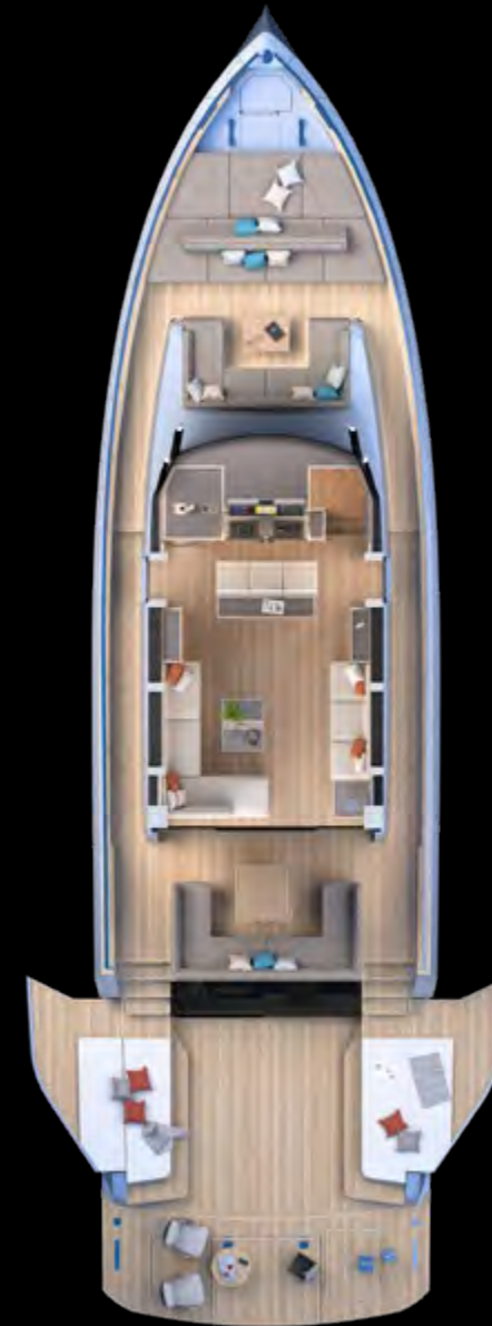
Main deck Beach Version