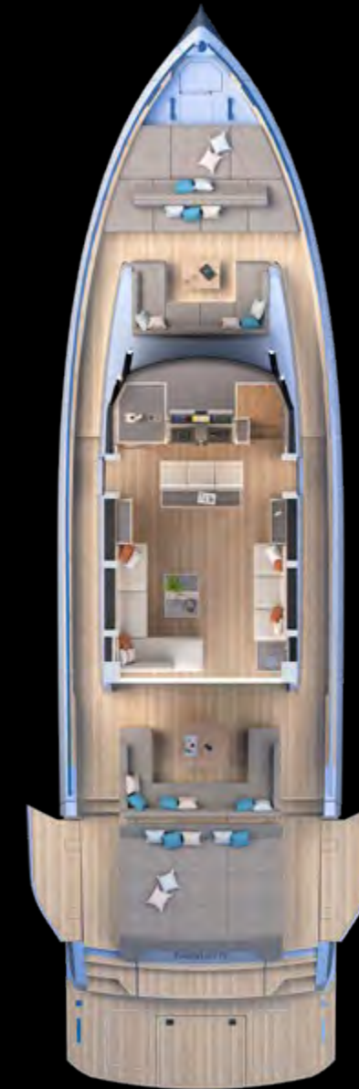
Main deck Tender Garage Version