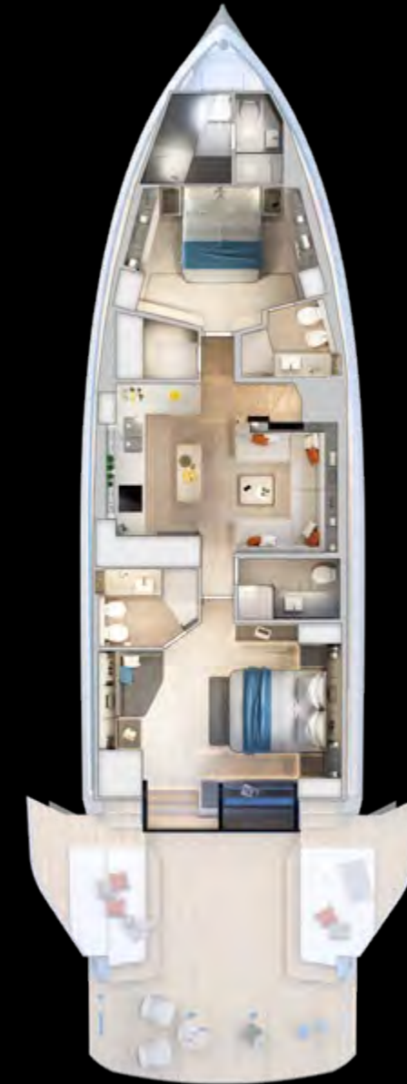
Lower deck Beach Version